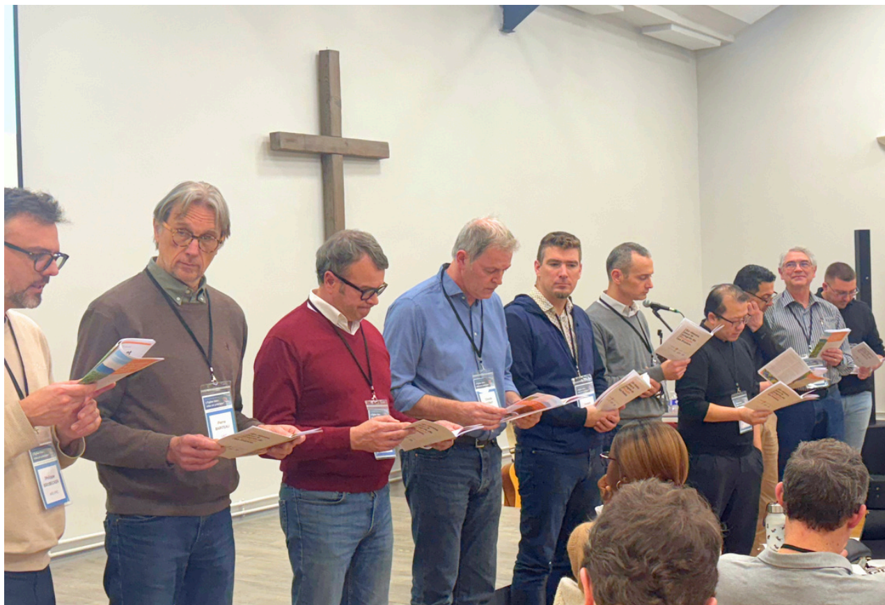
Lecture publique de la Partie N°2 : Vivre, lors du Séminaire Réseau FEF 2025.

Il nous faut les mettre en pratique et chercher à discerner ce qui se dessine devant nous pour mieux vivre la réalité de l’Église Une. C’est l’objet de la deuxième partie de « Être et vivre l’Église Une » (expression pour décrire l’Église universelle dont les enjeux dépassent le cadre des Églises locales et des unions d’Églises, voir encadré page 14).