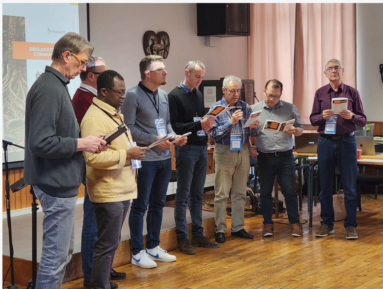
Lecture publique de la Partie N°1 : Être, lors du Séminaire Réseau FEF 2024.

Après plusieurs réunions de travail, les dirigeants d'unions participant au séminaire 2023 et le Comité National du R-FEF ont tenu à écrire cette déclaration commune qui dit un engagement fort et une volonté réelle de vivre "l'Église Une" ensemble. Un deuxième texte, consistant à déployer une série de propositions concrètes suivra ce premier volet.